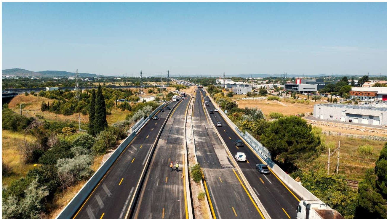
Les travaux de rénovation du pont supportant l'A709 sont en passe de se terminer

Dans le cadre des futurs travaux du Contournement Ouest de Montpellier, VINCI Autoroutes a engagé la rénovation du pont supportant l'A709, situé au-dessus de la voie ferrée (ligne Tarascon - Sète), entre les échangeurs de Saint-Jean-de-Védas (n°32) et de Montpellier Sud (n°30), sur la commune de Lattes. Pour ce faire, les conditions de circulation doivent être modifiées dans la zone de chantier sur l'A709. Afin de garantir la sécurité des équipes et des usagers, cette intervention nécessitera des modifications de circulation, uniquement de nuit, entre le lundi 6 juillet à 21h et le mercredi 8 juillet à 6h.