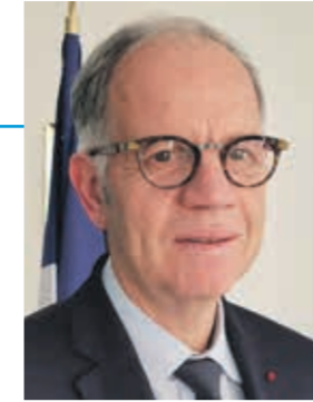
Philippe MAHÉ, Préfet du Var

« Le plan de relance autoroutier lancé il y a une dizaine d'années se concrétise à Toulon. C'est vraisemblablement le plus important chantier autoroutier de France actuellement.